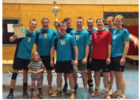
Ebenfalls erfolgreich: I. Herren holten den Kreispokal

Im zweiten Halbfinale setzte sich der Underdog USV Potsdam gegen den Landesmeister SF Brandenburg 94 ebenfalls mit 2:1 durch. Obwohl die Potsdamerinnen zwei Ligen tiefer angesiedelt sind, durften diese nicht unterschätzt werden. Auf dem